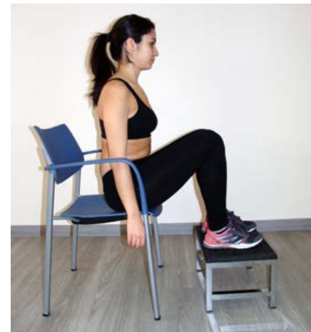
En la imatge, un exemple de posició defecatòria