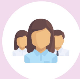
Grup impulsor extern