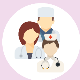
Grup impulsor intern