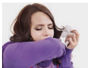
Evitar contacte persones infectades