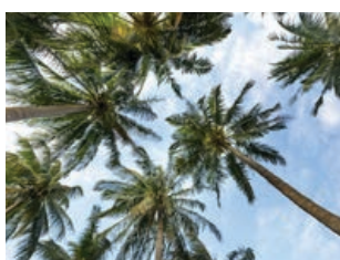
Consultar si viatges tropicals