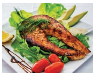
Menjar carn/peix molt fets