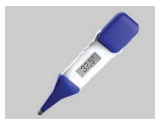
Acudir si febre