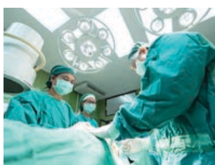
Avisar abans d'operar/proves