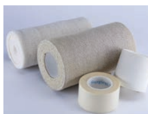
Acudir metge si ferides de pell