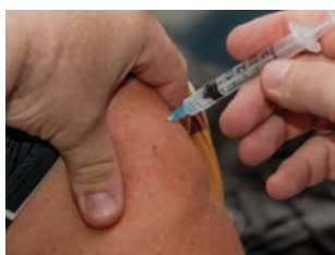
Vacunació pròpia i de familiars