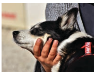
Rentat de mans al tocar animals