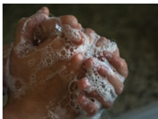
Rentat de mans i ungles tallades