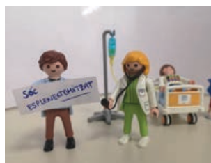
Comunicar si esteu operats de melsa