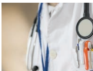
Facultatius han d'estar vacunats